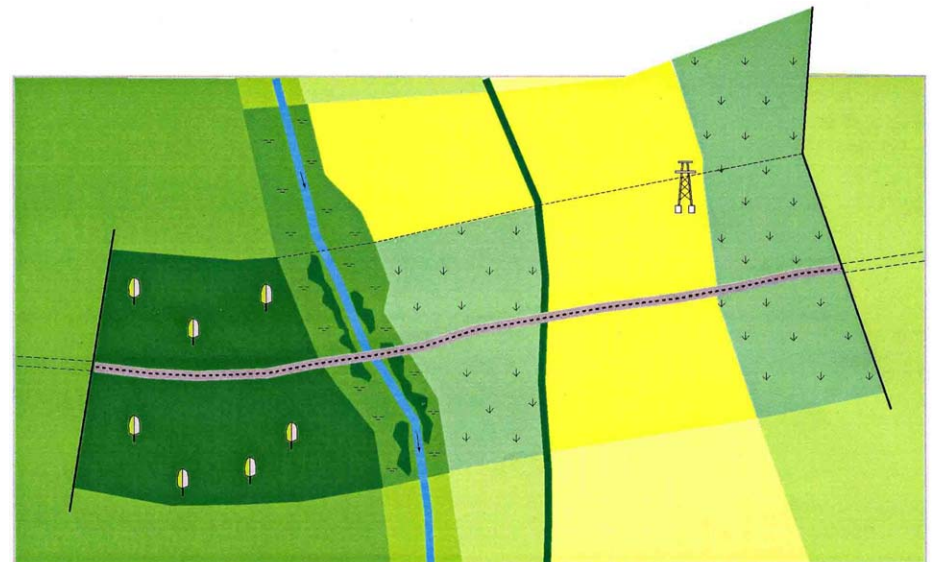
Abb. 2: Abgrenzung des Untersuchungsraums

Im Fallbeispiel ist der Neubau einer Straßentrasse geplant. Als Untersuchungsraum ist ein Streifen von jeweils ca. 300 m rechts und links der Trasse abgegrenzt, der im vorliegenden Fall den maximalen Wirkraum der Eingriffsauswirkungen abdeckt. Da der Untersuchungsraum auch die Flächen für Ausgleichs- und Ersatzmaßnahmen umfassen soll, werden darüber hinaus weitere, potentiell für die Kompensation geeignete Flächen am Nordrand des Untersuchungsraumes einbezogen.