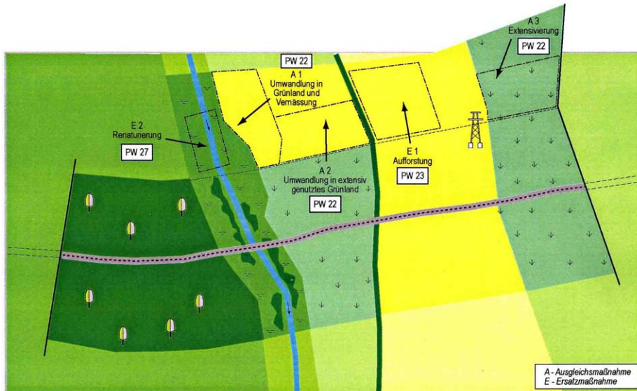
Abb. 8: Biotopbezogene Ausgleichs- und Ersatzmaßnahmen

Als biotopbezogener Ausgleich soll für die Beeinträchtigungen im Bereich FE 2 und FE 4 eine 1,10 ha große intensiv genutzten Ackerfläche in „Sonstiges Feuchtgrünland (artenreich)“ umgewandelt werden. Der Differenzwert zwischen dem Ausgangswert und dem Planungswert beträgt 17. Damit wird, bezogen auf die Fläche, eine Wertsteigerung von 18,7 WE erreicht. Gegenüber der Wertminderung im Bereich FE 2 und FE 4 von insgesamt 18,75 WE verbleibt im vorliegenden Fall ein Ausgleichsdefizit von -0,05 WE.