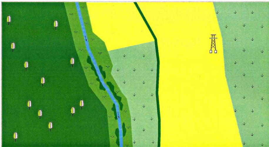
Abb. 1: Ausgangssituation

Als Ausgangssituation (vgl. Abb. 1) liegt ein land- und forstwirtschaftlich geprägter Landschaftsausschnitt vor.