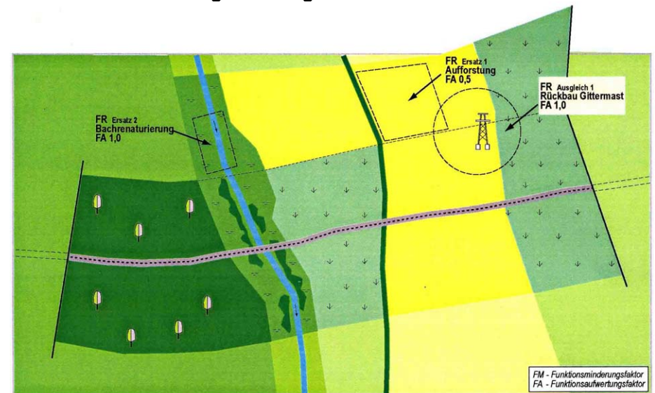
Abb. 7: Funktionsbezogener Ausgleich und Ersatz

Die durch Ersatz erzielten Wertsteigerungen sind im vorliegenden Fallbeispiel geringer als die verursachten Funktionsminderungen, wodurch sich ein Funktionsersatzdefizit von -2,83 WE ergibt. (vgl. F II, Spalte 26).