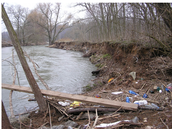
Zustand vorher - Blick flussabwärts