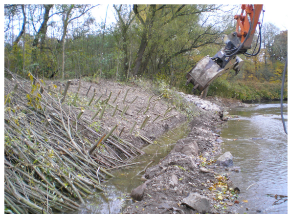
Zustand in Bauphase - Blick flussaufwärts