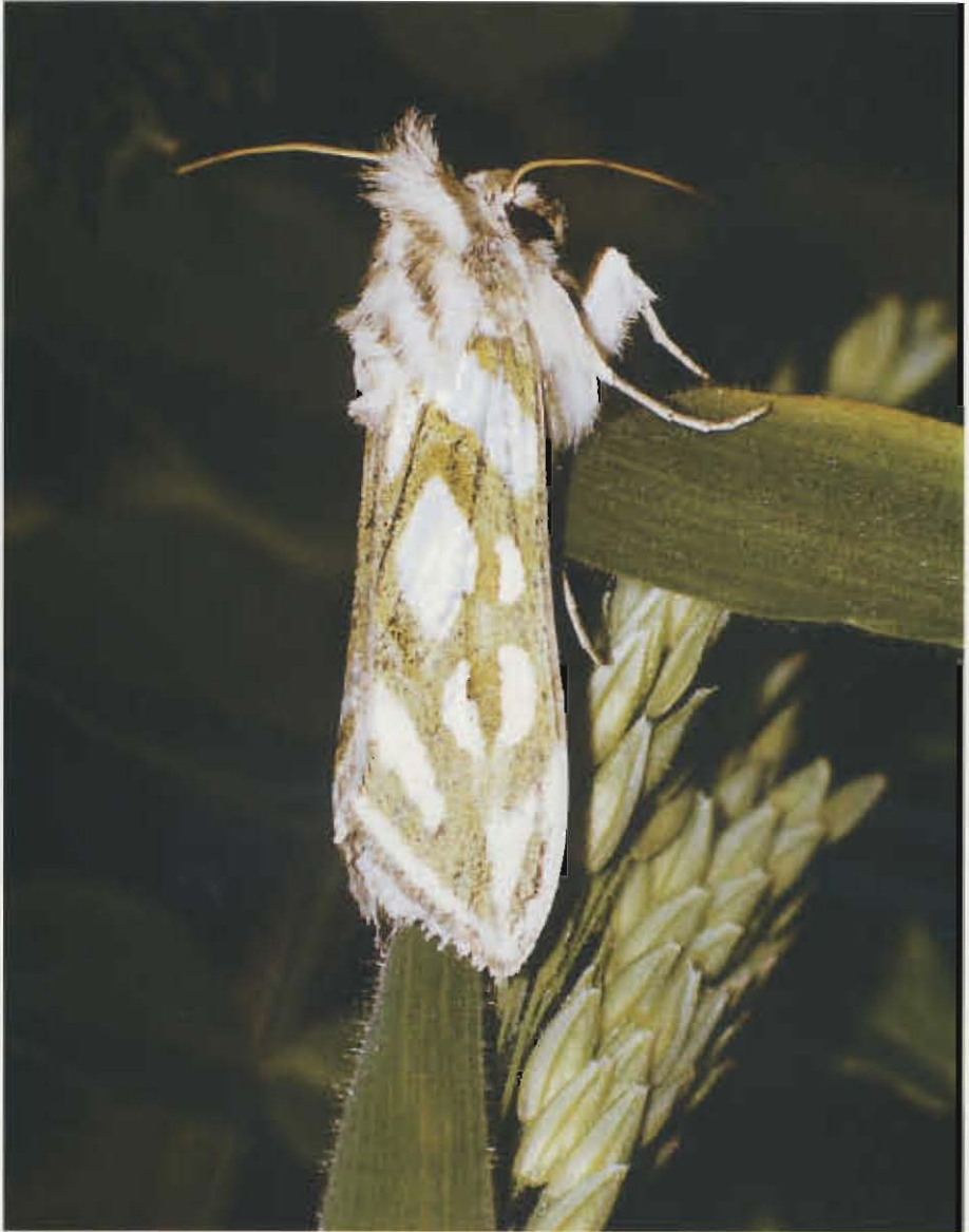
Silbermönch ( Cucullia argentea ).