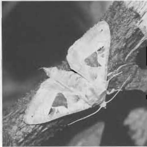
Smaragdeule ( Phlogophora scita ).