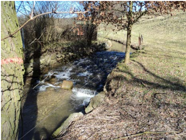
Zustand der unteren Wehranlage vor Durchführung der Maßnahme