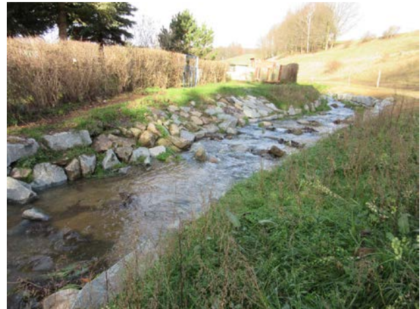
Zustand der oberen Wehranlage nach Durchführung der Maßnahme (November 2015)