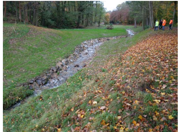
Zustand der oberen Wehranlage nach Durchführung der Maßnahme (Oktober 2017)