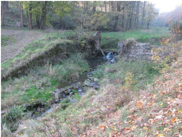
Zustand der oberen Wehranlage vor Durchführung der Maßnahme