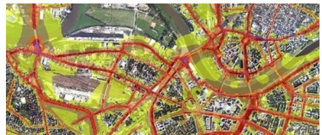
Abbildung 1: Visualisierung der Geräuschbelastung in einer Lärmkarte

kehr, Flugverkehr ...) sowie für die Ermittlung der Anzahl der betroffenen Personen, Wohnungen, Schulen und Krankenhäuser. Für die Erstellung des akustischen Berechnungsmodells werden umfangreiche Eingangsdaten benötigt (z.B. Lage- und Höhendaten des Geländes und der Bebauung, Fahrzeugaufkommen, Schwerverkehrsanteil, Geschwindigkeiten, Fahrbahnoberflächen, Einwohnerzahlen pro Gebäude usw.).