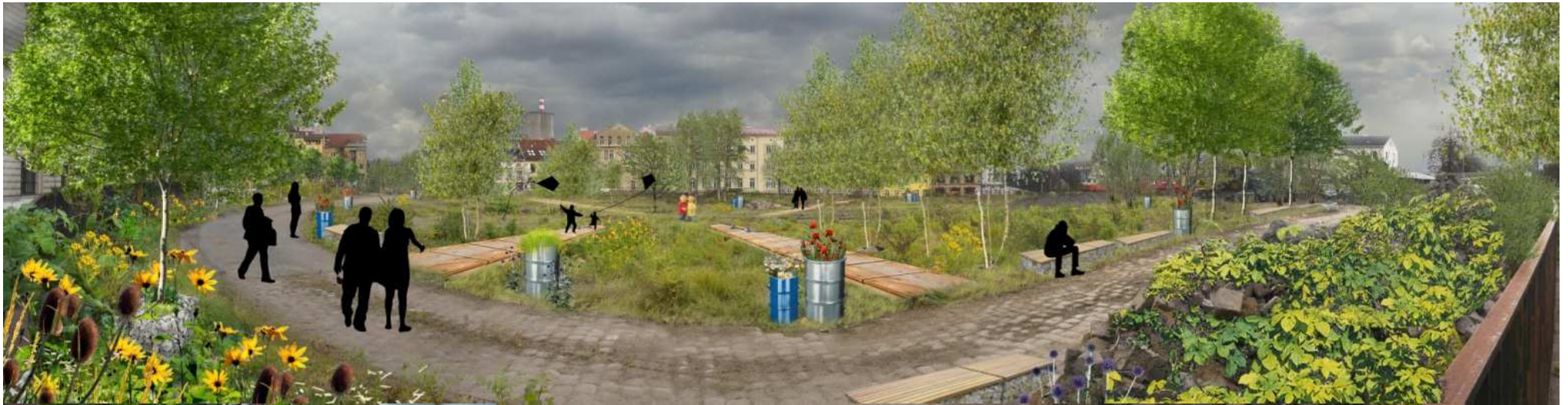
instatní park, (4th dimension architects)